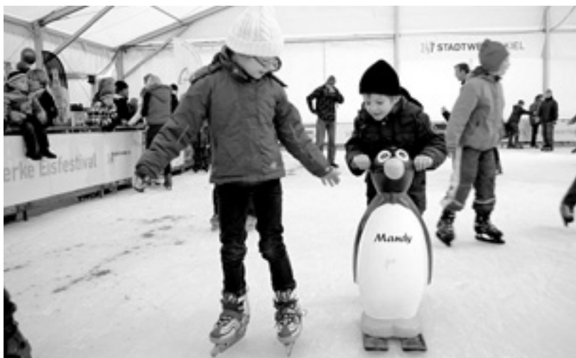
Schlechtwetter gibt es für Eislauf-Fans in diesem Jahr nicht: Mit einem Dach ist die Eisbahn beim 13. Stadtwerke Eisfestival gut geschützt.

Sie ist überdacht und benötigt weniger Energie: Die Fläche der neuen Eisbahn des Stadtwerke Eisfestivals bietet mit 750 Quadratmetern noch mehr Platz als die im vergangenen Jahr und ist damit die größte mobile Eisbahn überhaupt. Dazu hat sie ein Dach mit einem Sternenhimmel bekommen.